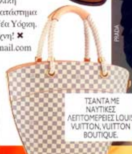
ΤΣΑΝΤΑ ΜΕ ΝΑΥΤΙΚΕΣ ΛΕΠΤΟΜΕΡΕΙΕΣ LOUIS VUITTON, VUITTON BOUTIQUE.