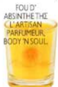
FOU D' ABSINTHE THE L'ARTISAN PARFUMEUR, BODY 'N SOUL.