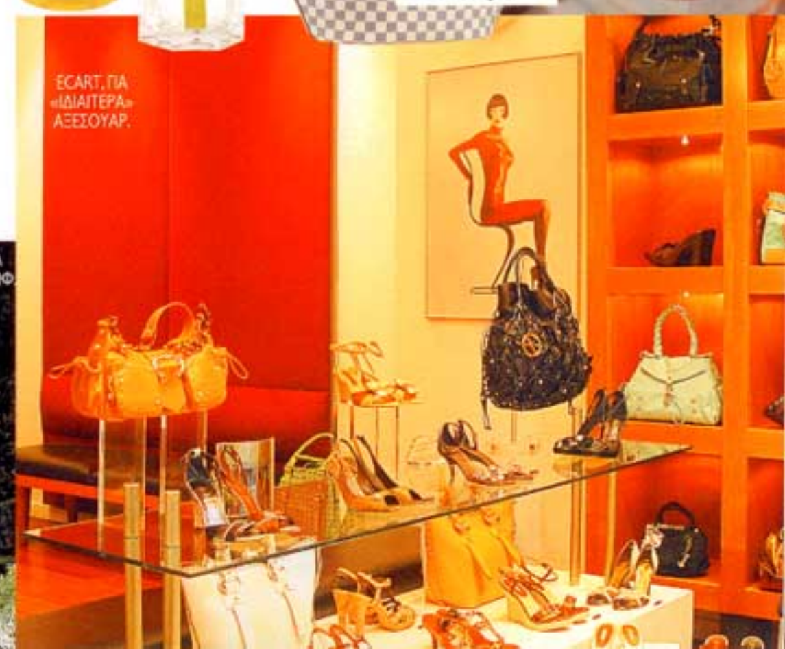
ECART, ΓΙΑ «ΙΔΙΑΙΤΕΡΑ» ΑΞΕΣΟΥΑΡ.