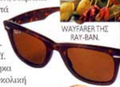
WAYFARER THE RAY-BAN.