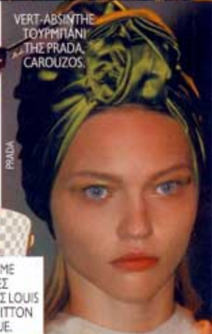
VERT-ABSINTHE ΤΟΥΡΜΠΑΝΙ THE PRADA CAROUZOS.